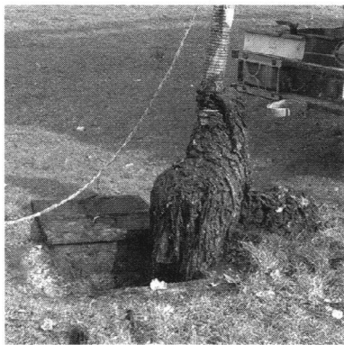
Vlažne maramice u kanalizacijskom kolektoru