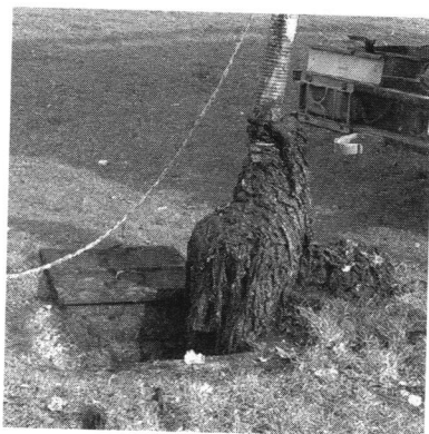
Vlažne maramice u kanalizacijskom kolektoru