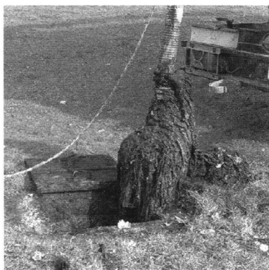
Vlažne maramice u kanalizacijskom kolektoru