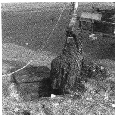
Vlažne maramice u kanalizacijskom kolektoru