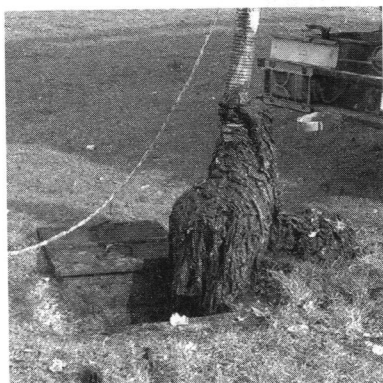
Vlažne maramice u kanalizacijskom kolektoru