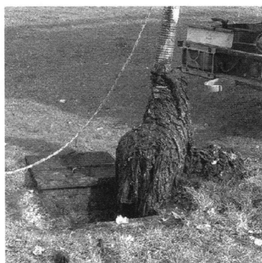
Vlažne maramice u kanalizacijskom kolektoru